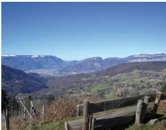
Vue depuis l'emplacement de la table d'orientation

④ Alt. 1250 m ... On descend légèrement en pente douce pour déboucher sur le chemin des Clots qu'on va remonter sur 100 m puis prendre à droite le chemin qui descend au Marais pour le quitter sur la gauche au bout de 30 m et suivre le petit sentier horizontal (nous sommes pratiquement toujours à la même altitude); continuer jusqu'à rencontrer une piste forestière qu'il faudra prendre à droite en descente sur 130 m avant de retrouver un autre sentier horizontal.