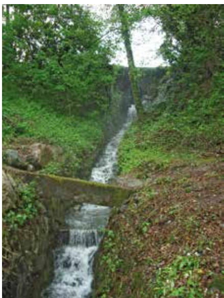
Le ruisseau des Moulins

A Depuis le parking derrière l'office de tourisme suivre le chemin en bas du talus en direction du Nord. Traverser la passerelle et après 50 m prendre à droite. Vue sur les fours à gauche (panneau 1). Le chemin monte légèrement et au petit replat observer les anciennes carrières à gauche. Continuer la montée, traverser le « ruisseau des Moulins » (anciennes conduites forcées apparentes). Dans la montée plus raide, si on se retourne, on a une vue d'ensemble sur la carrière, cachée par la végétation et interdite d'accès pour des raisons de sécurité. Nouveau replat, le chemin tourne légèrement à gauche pour arriver sous les remparts. Au croisement, on rejoint le sentier du Colombier, bifurquer à gauche sur le sentier qui remonte. On peut voir en contrebas l'ancienne « usine électrique » transformée aujourd'hui en maison d'habitation (panneau 2).