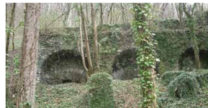
Les fours de la cimenterie

Premier des sept panneaux explicatifs qui jalonnent le circuit. Réalisés par l'Association du Patrimoine