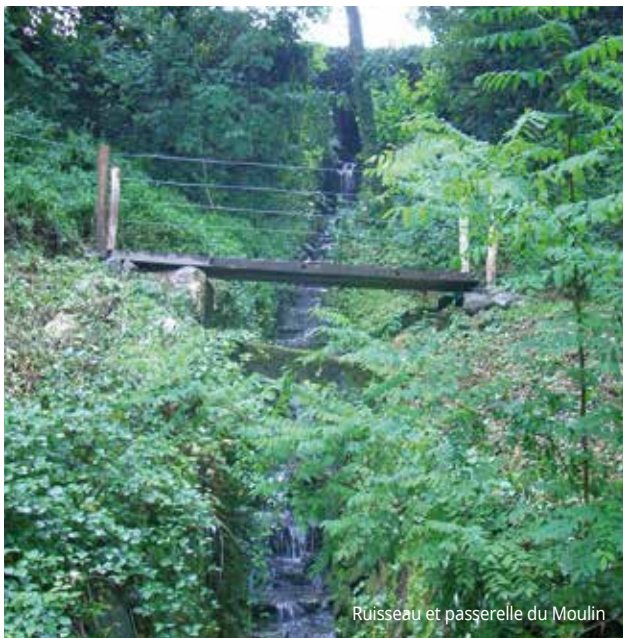
Ruisseau et passerelle du Moulin

D Dans le virage suivre le sentier à côté de la barrière de sécurité puis celui de droite (sentier du Tourniquet) qui descend par une pente raide en direction du Centre Hospitalier Rhumatologique, passer un croisement de chemins, aller en face puis le sentier bifurque à droite et passe devant la "Maison Aribert" sur notre gauche. Sur la droite on observera l'ancienne usine d'embouteillage (panneau 7 ). Avant de revenir à son point de départ il est possible d'observer dans le parc, au niveau du petit pont, entre le parking des tennis et le saule pleureur, l'alignement de trois clochers (établissement thermal, usine électrique et château).