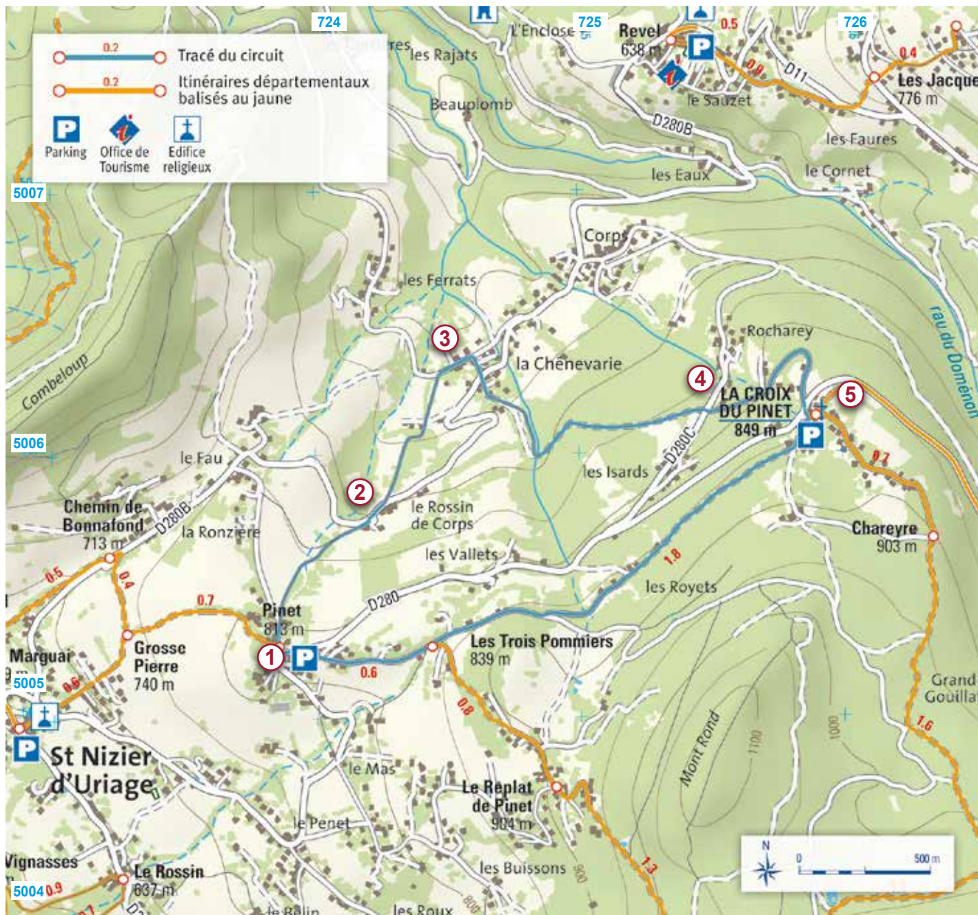
Les croisillons bleus correspondent au carroyage kilométrique UTM-WGS84 - Carte Mogoma