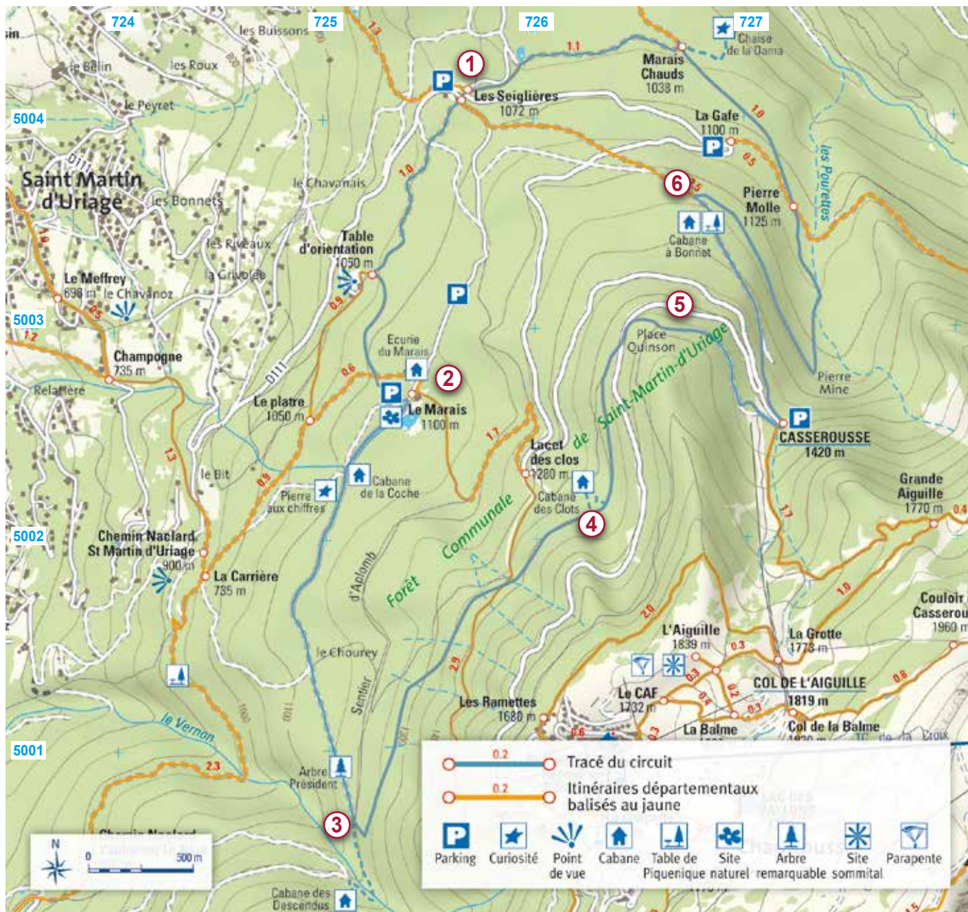
Les croisillons bleus correspondent au carroyage kilométrique UTM-WGS84 - Carte Mogoma

Après la visite de cette deuxième cabane du circuit reprendre la route à gauche et 60 m plus loin environ, un chemin encaissé qui part à droite en descente. Le prendre pour découvrir la première curiosité: l'énigmatique «Pierre aux Chiffres» (second gros rocher). Revenir sur ses pas jusqu'à la route, la continuer sur 300 m avant de prendre à droite un chemin en légère descente. Ce chemin en sous-bois bifurque légèrement sur la gauche; laisser un autre chemin venant de la droite avant de retrouver la petite route. La prendre sur la droite pour arriver dans la clairière du Chourey. Prendre en face une piste initialement plate puis assez pentue. Après 500 m on peut admirer sur la gauche (plaque explicative) la deuxième curiosité de ce circuit: l'immense «Arbre Président» de 44 m de haut et 4,5 m de circonférence à sa base.