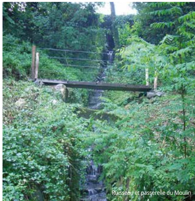
Ruisseau et passerelle du Moulin